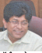
डॉ टी महादेव राव

भीष्म चुप थे जब अंबा ने आत्महत्या की भीष्म चुप थे जब पांडवों पर अन्याय हो रहा था भीष्म चुप थे जब धर्मराज के दुर्त्यसन और शकुनी के षडयंत्र से पांसे फेंके जा रहे थे भीष्म चुप थे जब कुल वधु का चीरहरण हो रहा था वह बचाव के लिए चीख रही थी भीष्म तब भी चुप थे जब अभिमन्यु को सात महारथियों ने मिलकर मारा था भीष्म की चुप्पी ने उन्हें कुलक्षेत्र युद्ध में शरशेया पर लिटाया था उन्हें पीड़ा और दुःख का लंबे समय तक एहसास कराया था चुप्पी तटस्थ होने का संकेत नहीं प्रतीक है गलत का विरोध न करने का चुप्पी है स्थितियों को जस का जस आत्मसात करने का समझौता चुप्पी है स्वयं को परास्त और त्रस्त मान लेना चुप्पी तोड़ें तो कुछ बात बने चुप्पी छोड़ें तो नया साथ बने।।