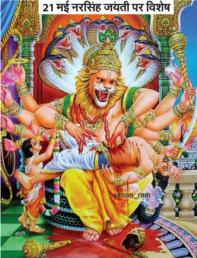
21 मई नरसिंह जयंती पर विशेष

हिरण्याक्ष और हिरण्यकश्यप था हिरण्याक्ष का वध भगवान विष्णु ने